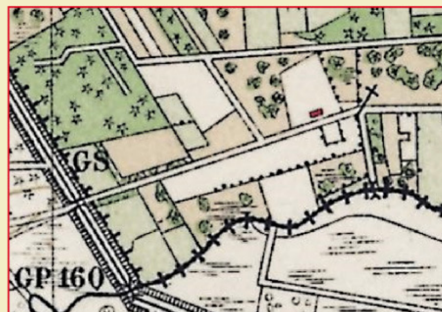
Topografische kaart 1928: Grenspaal 160, woning/café 'de Grave', Gravekruis met ten zuiden daarvan oversteek over de Abeek naar het Stramprooierbroek.

Het gedenkteken werd vervaardigd door kunstenaressen Els Maes-Verdonschot en onthuld op 21 september 2014. 70 jaar na de bevrijding van de Tweede Wereldoorlog, 100 jaar na het begin van de Eerste Wereldoorlog en 175 jaar na de deling van Limburg door een landsgrens. Daar waar twee landen, twee Limburgen en vier gemeenten samenkomen en waar in beide wereldoorlogen tientallen vluchtelingen de weg naar de vrijheid vonden.