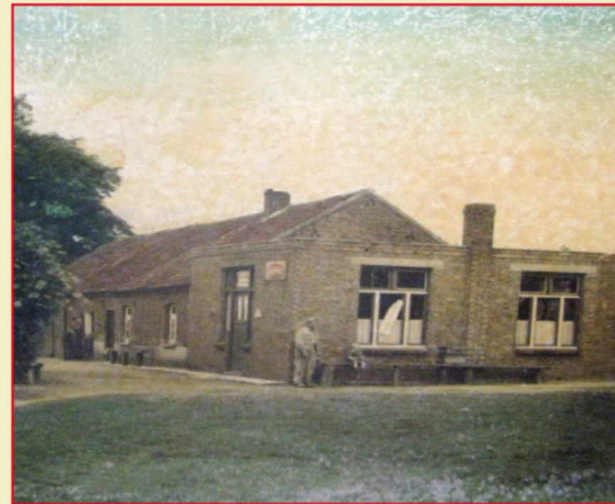
Voormalig café en woning 'de Grave'