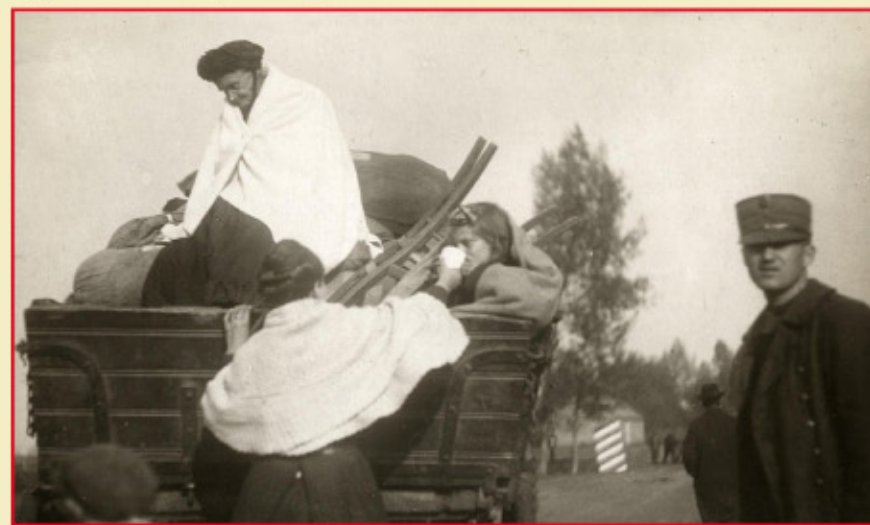
Franse vluchtelingen komen aan in Stramproy in oktober 1918

Deze route van 8 kilometer kan gestart worden bij het Vosseven, Lochtstraat 28 in Stramproy of bij Natuur.huis Mariahof, Mariahofstraat 51 in Bree en is in beide richtingen te volgen. Na een tocht over smalle drassige paden en langs de Abeek kom je weer veilig terug bij de startplek. Je maakt onderweg kennis met het geheimzinnige Stramprooierbroek en de grote vijvers van Mariahof en de Luysen. Zonodig kun je schuilen in één van de vogelkijkhutten. Kijk dus goed uit!